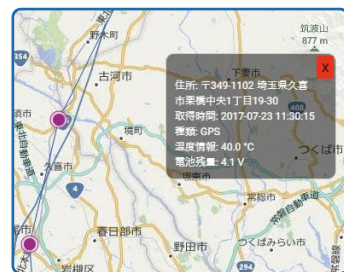
位置詳細情報の確認