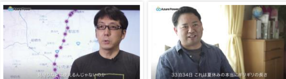
見守りながら楽しむんじゃないの