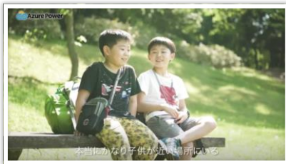
本物になり子供が近距離にいる

小学生2人だけで行く、33泊34日の旅。 夏休みをフルに利用した、東京から礼文島約1500kmの行程は子供たちには冒険そのもの。 この旅では、持参させたGPSトラッカーが常に子供たちの居場所を親に伝えてくれる。